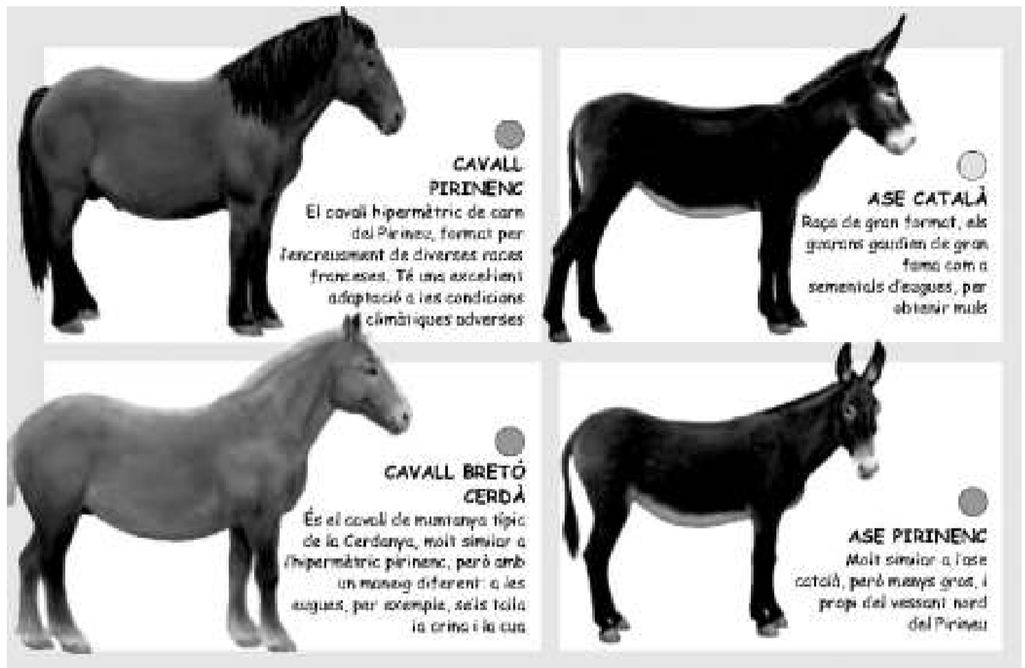
Fragment del pòster que regalen aquesta setmana Presència i la Fundació Territori i Paisatge.

En el pòster hi apareixen la major part de les races de bestiar autòcton no extingides –més tres d'extingides, que no són totes, però que s'hi han volgut posar per la seva importància històrica–. Altres races, com el porc de Morella o el gos de Gorga, no s'han il·lustrat per manca absoluta de documentació. Pel que fa als dibuixos, l'opció ha estat intentar presentar l'animal estàndard de la raça, tant pel que fa a la seva morfologia, com al pelatge. En alguns casos s'ha optat per presentar més d'una varietat –gos d'atura català o cabra de Rasquera–, però en cap cas no s'ha pretès il·lustrar en cada raça totes les varietats possibles. En les races extingides, les característiques externes s'han obtingut a partir de documentació antiga, en alguns casos fotogràfica o dibuixos, però també a partir de l'estudi de races del mateix tronç.