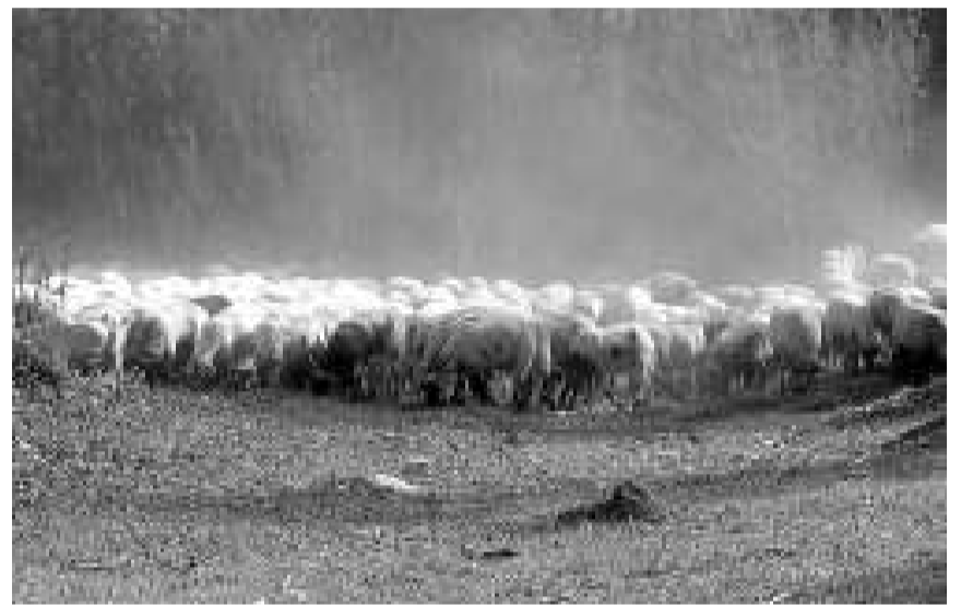
A l'esquerra, un Muntanya dels Pirineus com els que es duran a Alinyà. A la dreta a dalt, cabres de Rasquera a Alinyà, i un ramat transhumant.