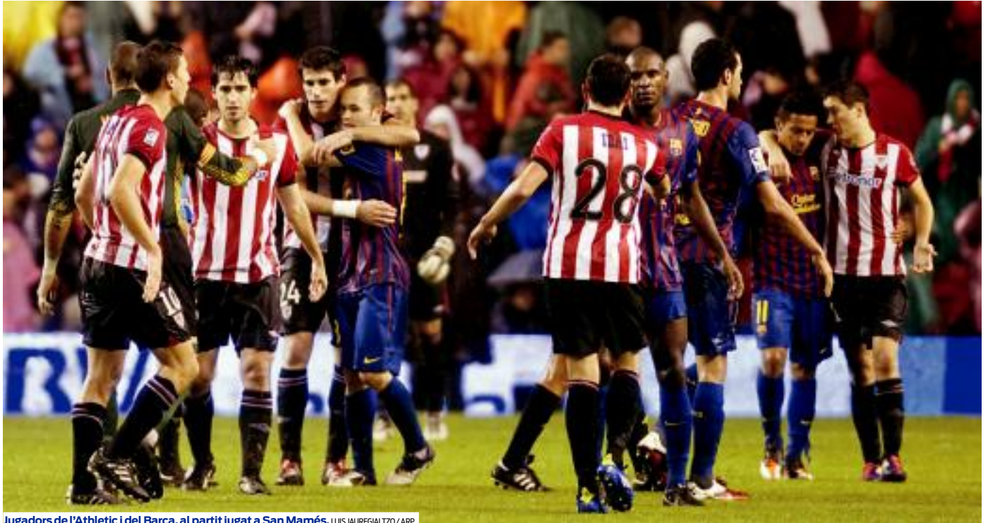
Jugadors de l'Athletic i del Barça, al partit jugat a San Mamés.