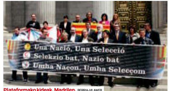
Plataformako kideak, Madriren.

cions a competir internacionalment, de manera oficial i sense interferències. A Madrid i acompanyats per entitats de la societat civil i representants polítics, les plataformes basca i catalana van fer una crida específica a dur aquesta demanda històrica a la final de la Copa del Rei d'aquest divendres.