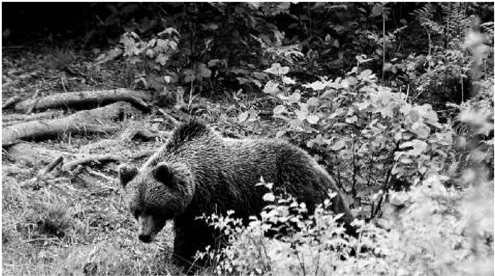
Aquest ós bru, fotografiat a la reserva natural de Kochevie (Eslovènia), podria ser un parent dels que s'alliberaran a partir de mitjans d'abril al Pirineu.