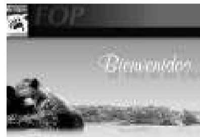
Web de la Fundación Oso Pardo (FOP).