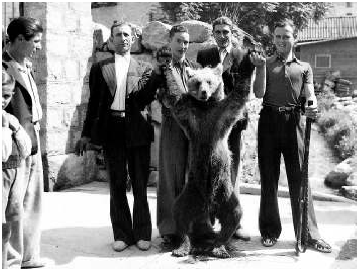
L'última óssa d'Andorra –en realitat caçada a la vall Ferrera–, exhibida a la Massana, el 21 d'agost...