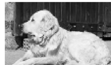
Un exemplar de gos de muntanya dels Pirineus. / JORDI COMELLAS

● La reintroducció dels grans carnívors altera la tranquil·litat dels ramats en les pastures d'alta muntanya. En els darrers cent anys, gairebé, n'hi ha hagut prou amb els blocs de sal ben repartits pels prats, sense que fes falta cap més atenció in situ . L'ós i el llop impliquen també la recuperació dels antics sistemes de vigilància: el pastor i els gossos de protecció. Per als especialistes el gos ramader o mastí és el principal mètode per protegir els ramats dels atacs dels grans carnívors. Mai de la vida no s'ha de confondre el gos de muntanya dels Pirineus amb el gos d'atura. El gos ramader és gegant i blanc per distingir-lo bé de nit, viu entre el bestiar com una ovella més, pren decisions al marge del pastor i porta un collar de punxes que el protegeix dels ullals dels llops.