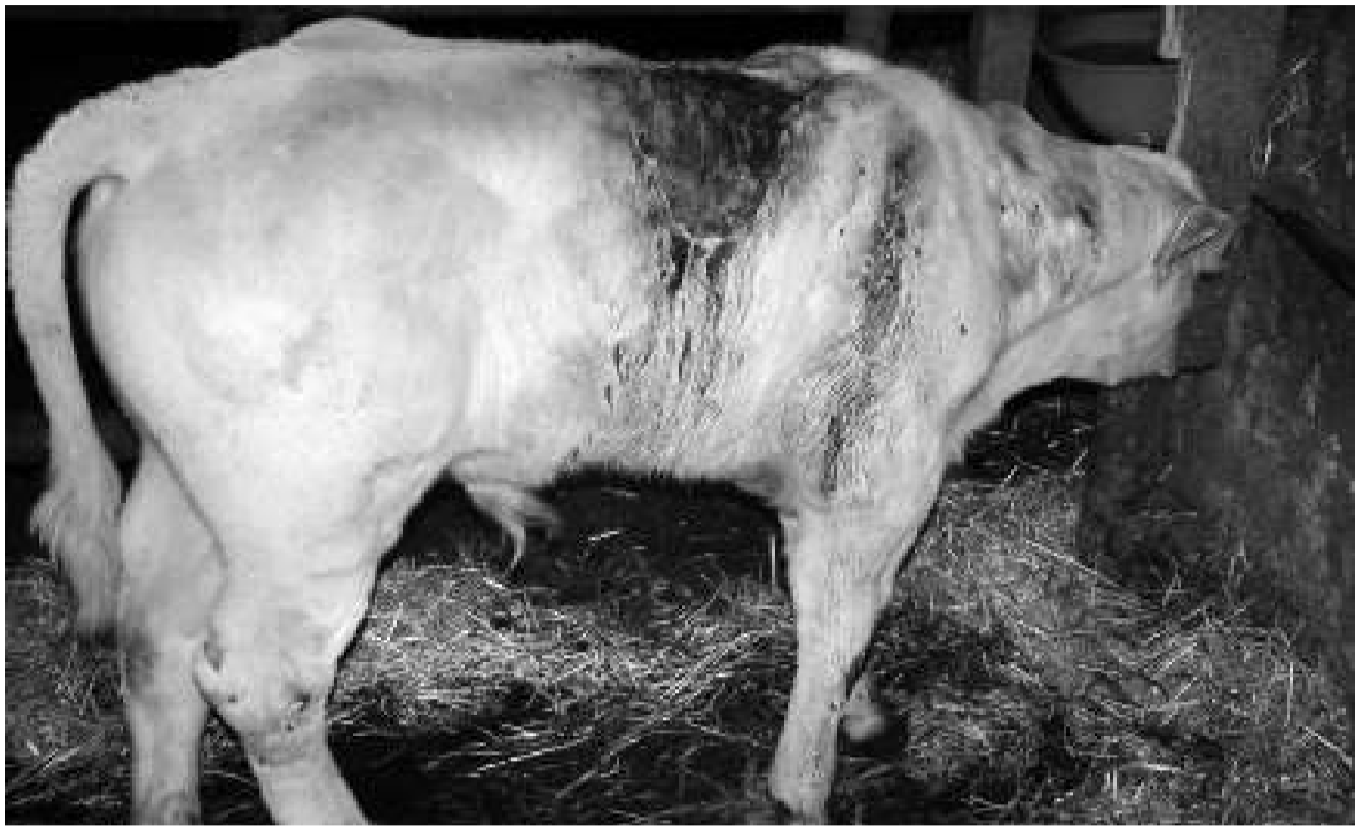
Així d'espallat va quedar aquest vedell de Canillo (Andorra) després de l'atac d'un ós, probablement Boutxy, el setembre del 2004.

Sigui com sigui, la presència de l'ós al Pirineu sembla ja un fet irreversible. Segons els biòlegs, la serralada podria acollir a mitjà i llarg termini una població permanent de fins a un centenar de plantígrads. Així que això acaba de començar i tots, inclosos els seus adversaris més recalci-trants, ens haurem de fer a la idea que compartim la finca amb l'últim gran carnívor d'Europa.