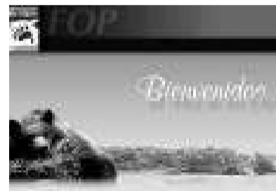
Web de la Fundación Oso Pardo (FOP).