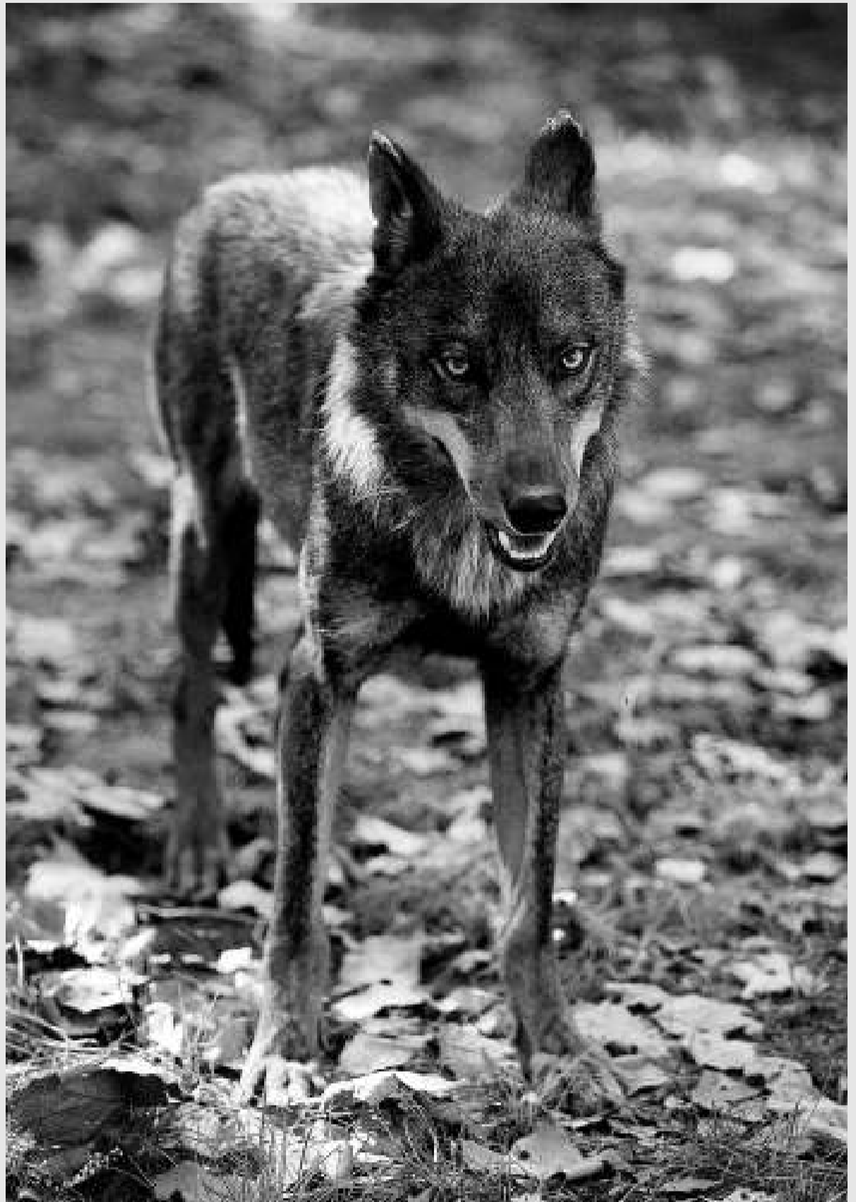
Un dels llops en captivitat al Parc Zoològic de Barcelona.

L'OPINIÓ DEL MÓN URBÀ SOBRE EL LLOP NO ÉS DIFERENT DE LA DEL MÓN RURAL, ÉS OPOSADA