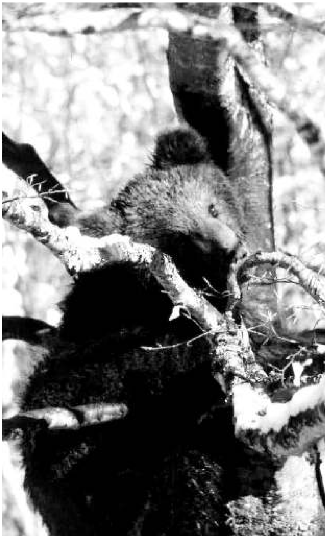
Nere, fill de Giva, nascut el 1997, ha traslladat la residència al Pirineu occidental.