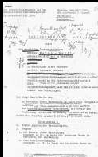
Clarsobscurs. Homenatge als republicans deportats. Treballadors a l'Alemanya nazi. Camp de concentració de Flossenbürg on deia haver estat tancat. Acta d'acusació per haver conspirat contra el Tercer Reich.