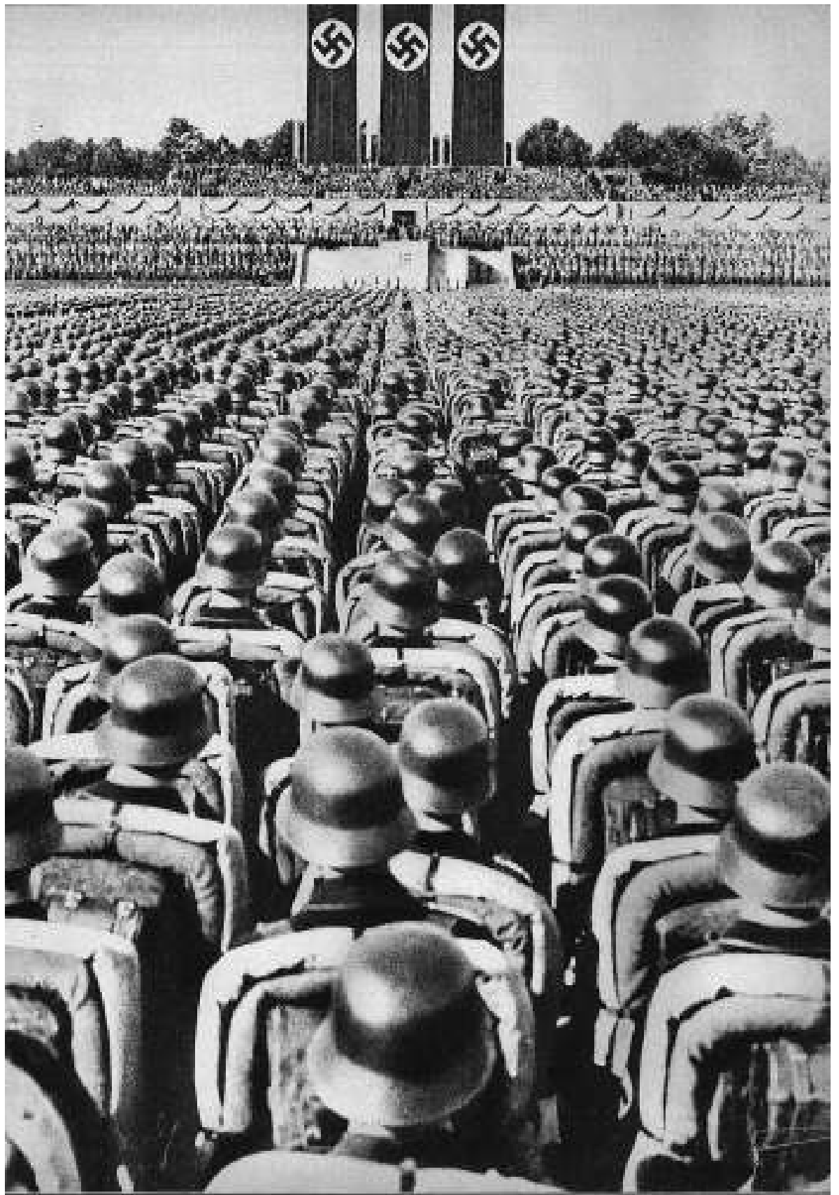
Exèrcit del Tercer Reich que va posar Europa en peu de guerra.

Segurament que molts professors i alumnes de Catalunya es reconeixen com a participants de debats com el que ara sintetitzem. Es va fer el 8 de març del 2002, hi van participar un grup d'estudiants del cicle superior de secundària (entre 14 i 16 anys), amb el propòsit de parlar sobre el tema de la immigració, i va ser gravat amb el consentiment de tots els assistents. Els noms dels alumnes són ficticis en consideració al temps passat i al fet que el jove que es declara racista ha superat àmpliament el prejudici. Hem optat també per respectar la llengua d'expressió de cada un perquè il·lustra una realitat que cal tenir present. En peça a part, titulada Esclau o lliure , reproduïm la molt sentida introducció de l'acte a càrrec d'Enric Marco, amb referències al seu suposat pas per un camp de concentració.