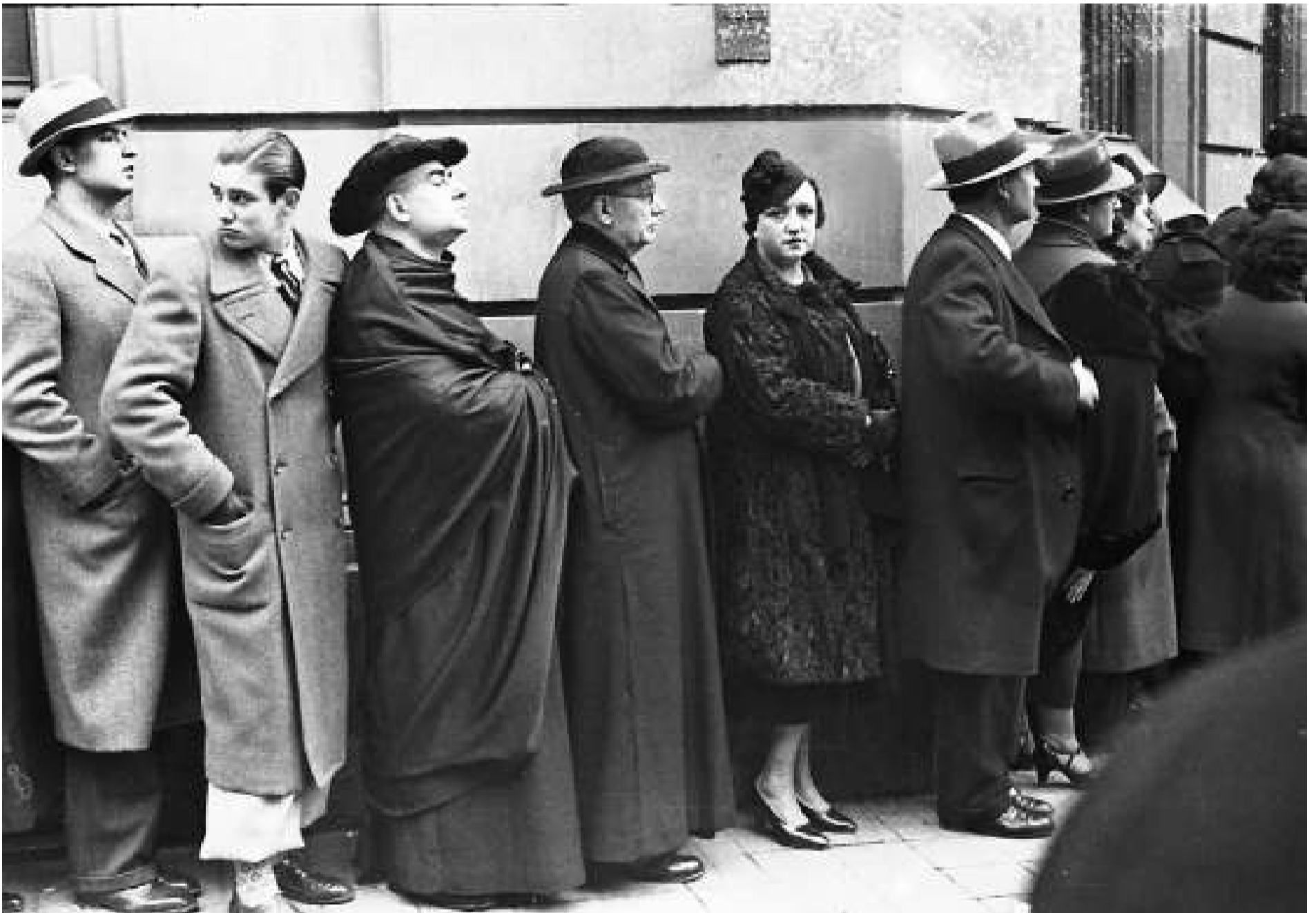
Cua de votants al carrer Casp de Barcelona, en les eleccions del 16 de febrer del 1936. És ben diferent d'altres cues també retratades Centelles, on es veuen obrers i gent humil somrient, anticipant segurament la victòria del Front d'Esquerres.