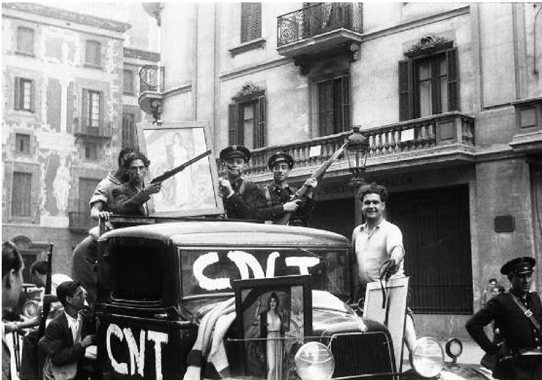
Militants anarquistes i guàrdies d'assalt, en un cotxe requisat el juliol del 1936, a la Via Laietana de Barcelona. El cotxe està engalanat amb quadres al·legòrics de la República i pintat amb la sigla de la confederació anarquista CNT.