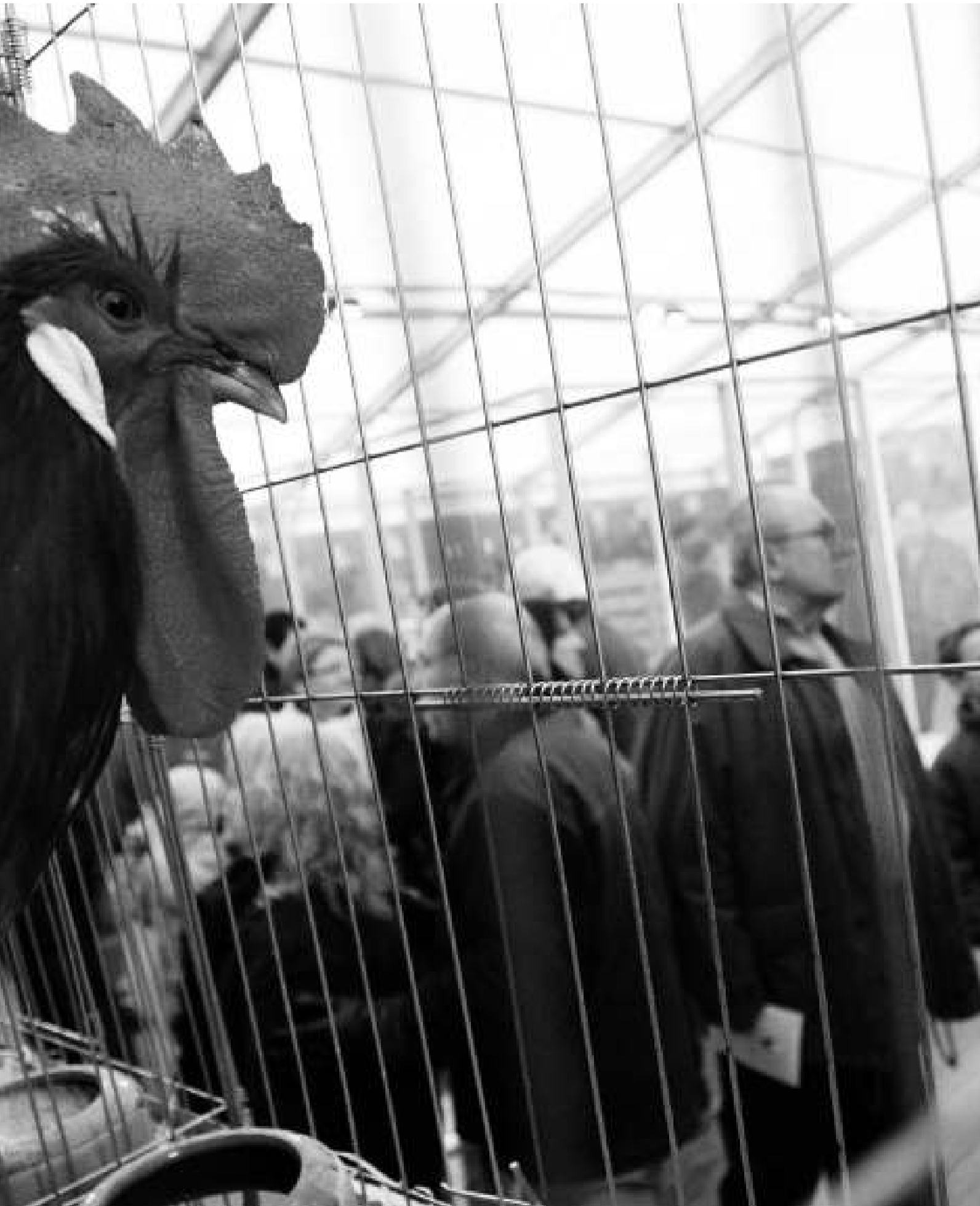
Un gall del Prat en la tradicional fira que es fa cada desembre al Prat de Llobregat al voltant d'aquesta raça d'aviram autòcton. /GABRIEL MASSANA

pies de l'hemisferi nord, sembla que provenen de l'oca salvatge ( Anser anser ), procedent del nord d'Euràsia. Es té constància que entre el anys 4.000 i 2.500 aC ja se'n domesticava a l'Àsia menor i a Egipte. Els romans ja sabien com engrèixar-les i augmentar-los artificialment el fetge.