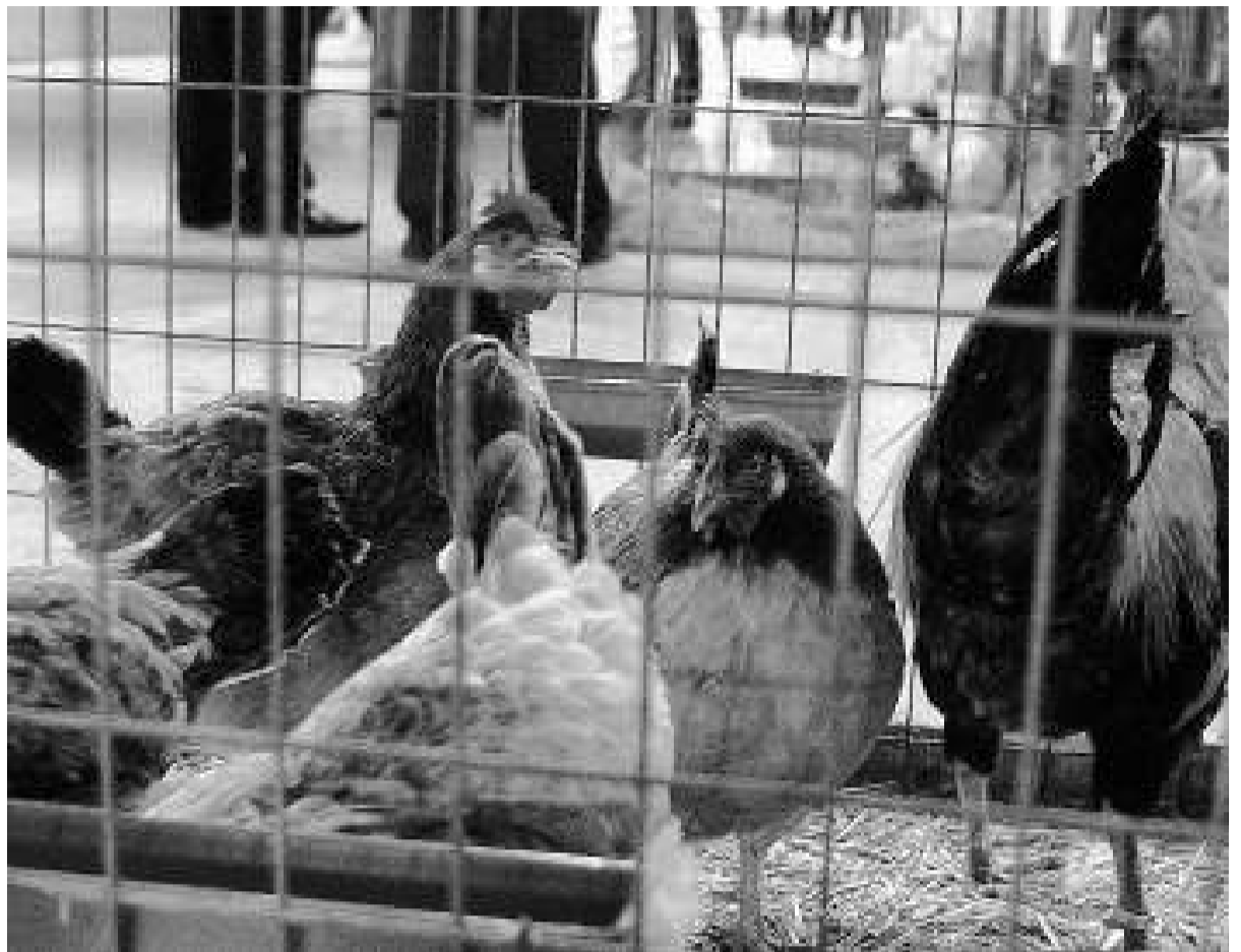
Galls i gallines a l'exposició d'aus de raça Ciutat de Valls, que organitza l'associació El Francolí.

La intenció és poder recuperar-ne la utilitat per a la població de colom roquer que viu a la zona i també per a les diferents espècies de depredadors que l'envolten. Els colomars són un dels elements més característics de la comarca de Tierra de Campos i ens fan remuntar fins a l'època de l'imperi Romà. Fins a finals del segle passat, la cria de coloms i l'aprofitament dels colomins era un important complement per a l'economia de la gent d'aquella zona. Avui en dia, la majoria dels colomars estan abandonats i en ruïnes i hi ha el perill que amb ells desaparegui el que consideren que és un dels senyals identificatius de la comarca. Amb la recuperació d'aquests elements arquitectònics es vol, d'una banda, donar a conèixer les característiques bàsiques d'un dels elements més significatius de la comarca i, d'altra banda, afavorir la conservació de diverses espècies d'aus, sobretot el colom roquer, però també les poblacions de falcó pelegrí, de mussol comú i d'òliba. «Nosaltres—continua—hem pagat la restauració de tres edificis, dos de rectangulars i un de planta rodona; però, a més de posar-hi coloms, també se'n pensa aprofitar el guano, que són els excrements dels coloms i que són excel·lents per adobar els camps, tal com feien abans els pagesos d'aquella zona», explica Marga Viza, cap de l'àrea de Coordinació i Projectes de la FTP. / J.C.