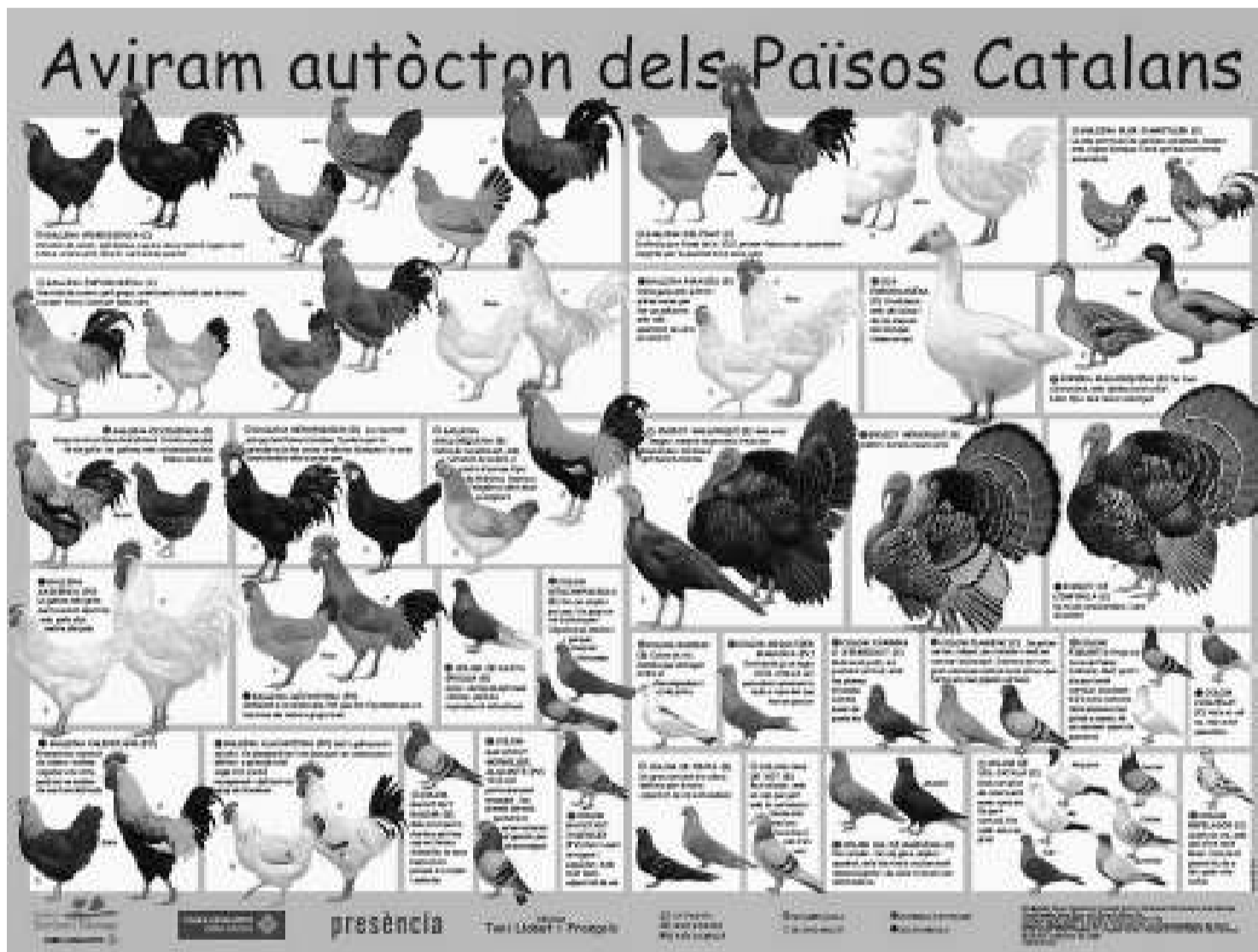
El nou pòster que han produït i publicat Presència i la Fundació Territori i Paisatge.

Les il·lustracions del pòster són de Toni Llobet, que ja s'ha encarregat dels dibuixos de set de les