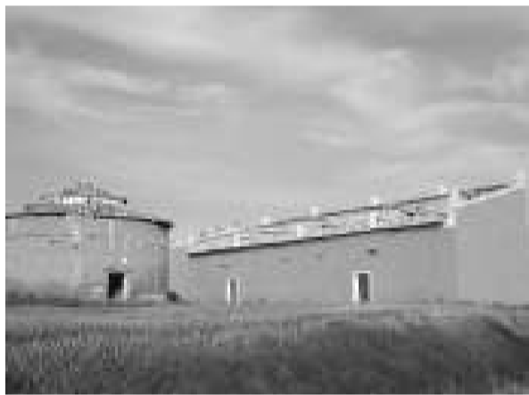
Un dels colomars restaurats a Tierra de Campos.

Pel que fa a la resta de l'Estat, destaca el projecte de Pedraza de Campos, a la comarca de Tierra de Campos, a Palència, on s'estan restaurant uns antics