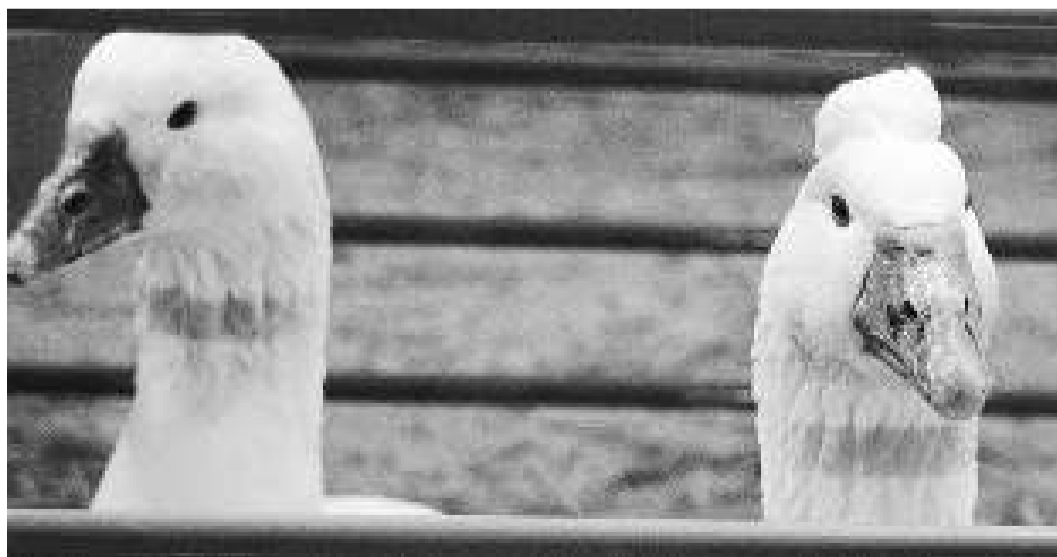
Un parell d'oques empordaneses, l'única raça d'oques del país.

Algunes d'aquestes races tenen gran varietat de plomatges, com ara la gallina penedesenca i l'empordanesa, i d'altres, com és el cas del colom de vol català, presenten una gran varietat de colors