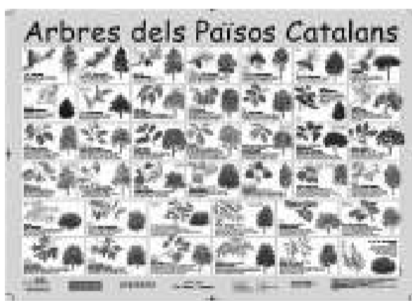
El pòster dels arbres, un dels publicats aquest any.