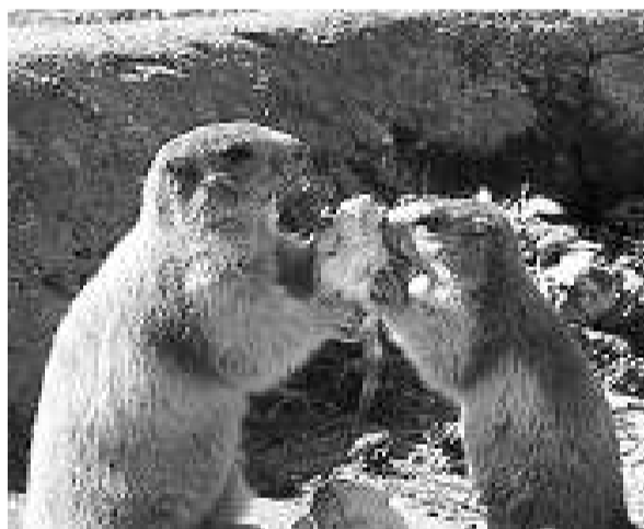
La marmota, un dels mamífers del parc. / J. COMELLAS

En els indrets més inaccessibles i, per tant, més difícils d'observar, generalment boscos d'abet i de pi negre, hi podem trobar indicis de la presència del picot negre, del gall fer, del mussol pirinenc i del trencapinyes.