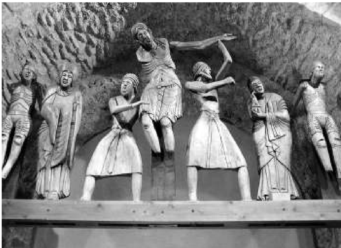
El pantocràtor de Taüll i el davallament d'Erill la Vall, dues de les grans obres del romànic de la Vall de Boí. / JORDI COMELLAS

Els representants dels amfibis serien el trítol pirinenc, la salamandra, el tòtil, el gripau i la granota roja, i pel que fa als peixos, la truita comuna, que es pot observar fàcilment en molts estanys.