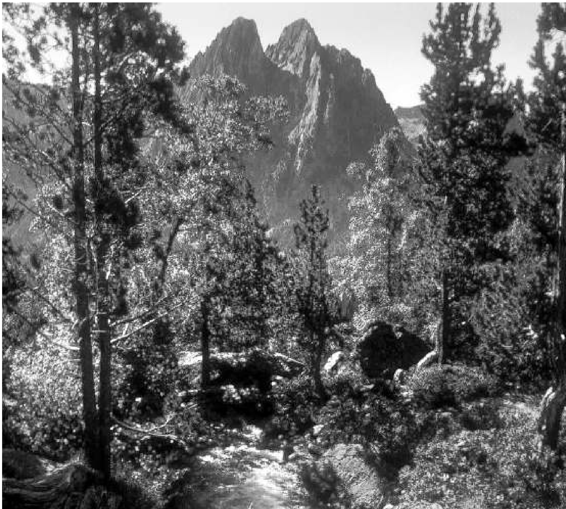
Els Encantats, amb la seva inconfusible silueta, no són els cims més alts del parc, però sí que són els més coneguts. / SALVADOR REDÓ