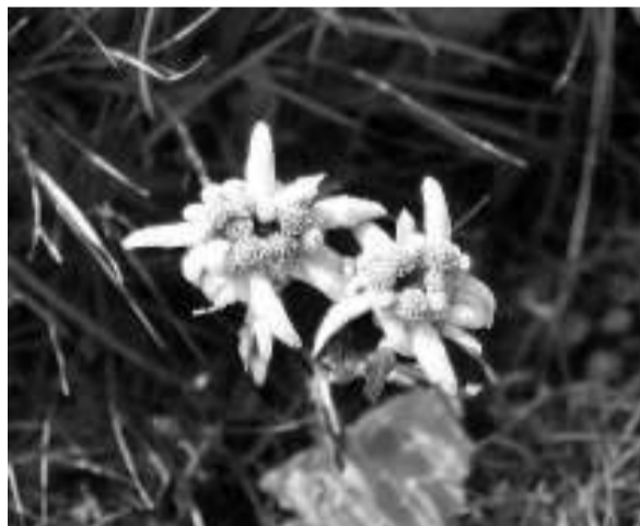
La flor de neu, un autèntic mite per als excursionistes.

Enguany, però, com un regal d'aniversari, la natura del parc ha estat benèvola i ha fet florir la flor de neu, una espècie tan apreciada pels excursionistes i els amants de l'alta muntanya com difícil de trobar. A principis d'aquest estiu, tres biòlegs de la Universitat de Barcelona han aconseguit localitzar aquesta flor al sector