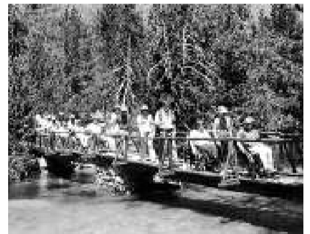
Les passarel·les faciliten el pas de cadires.

La passarel·la del planell d'Aigüestortes, a Boí, fa 450 metres de llargada i transcorre per damunt de petits riuets on fa uns milers d'anys hi havia un estany que a poc a poc es va anar omplint de sediments fins a formar aquest espai. En total són 1.000 metres de recorregut.