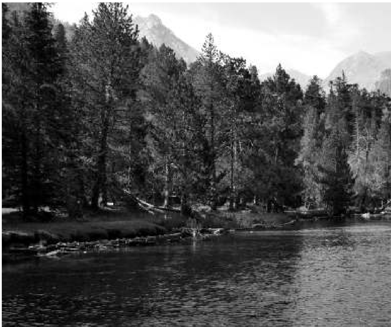
El camí fins a Aigüestortes, des de la Vall de Boí, és tota una aproximació a la part baixa del parc.

És una flor que fa de 3 a 5 centímetres de diàmetre i creix als pasturatges alts i roquissers del Pirineu, sobretot als massissos calcaris del sector occidental entre els 1.700 i els 3.200 metres d'altitud. Al sector oriental només se n'han pogut trobar a la comarca del Berguedà, a Falgars.