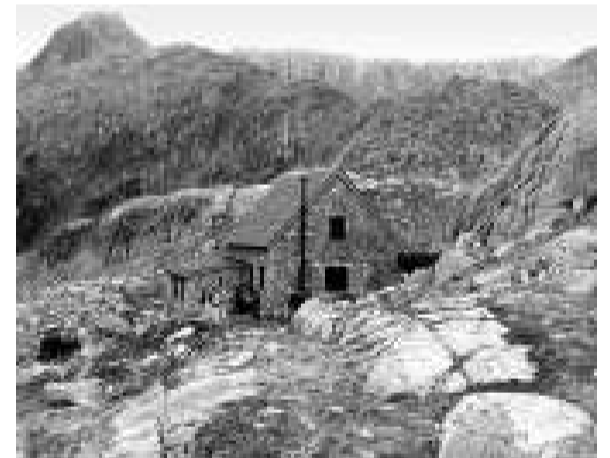
Refugi Ventosa i Calvell.

— Observacions: És un itinerari ideal per poder tenir una visió general del que és l'alta conca del riu Escrita i que, alhora, permet observar durant pràcticament tot el seu recorregut un paisatge espectacular dominat pels impressionants pics i per les crestes retallades.