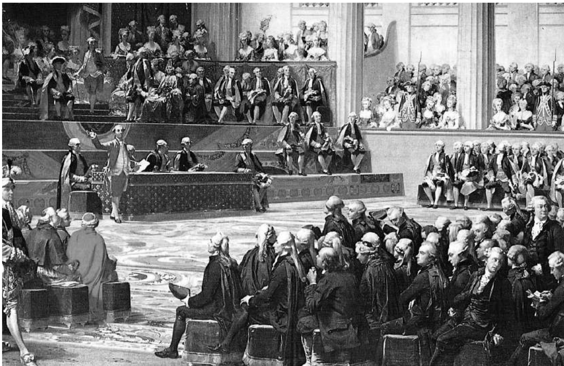
Sessió d'obertura dels Estats Generals a Versalles.

voluntat de posar fi als privilegis de raça, sexe i classe com a justificants naturals de la injustícia i la desigualtat. La dialèctica, amb el pas del temps, s'establiria entre uns termes que en el fons no estan pas gens absents del debat actual, tot i que se n'hi hagin incorporat d'altres: passat i futur, capital i treball, naturalesa i història, jerarquia i igualtat, autoritat i llibertat.