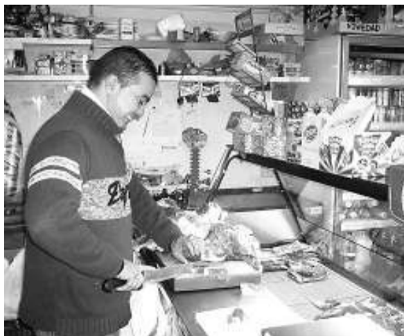
Imatge d'un comerç de Tortosa.

► La dreta. D'entrada situa el fenomen immigratori en una vessant negativa i s'hi sol referir amb un llenguatge carregat de connotacions despectives i criminalitzadores. Utilitza dos tipus d'argumentari molt clars: el més clàssic, d'arrel essencialista : són gent de fora, arriben massivament i en poc temps acabaran contaminant-nos i fent que perdem els nostres costums tradicionals; i el més modern, definit com a ciudadanista : competeixen amb els espanyols pels recursos escassos i com que no n'hi ha per tots —de recursos— hem de defensar la gent d'aquí que hi tenen més dret. És un missatge que obvia intencionadament la contribució dels immigrants a la riquesa econòmica i social del país on s'instal·len i que té un rerefons racista basat en el diferencialisme cultural i en la selecció dels considerats més integrables.