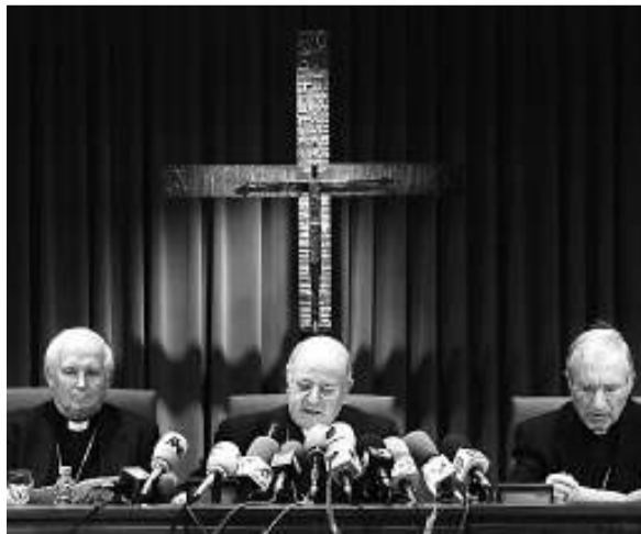
Blázquez, Rouco Varela i Cañizares.

► La dreta. Pretén mantenir els privilegis de què gaudeix l'Església oficial, perquè en el fons subsisteix una vinculació entre la vella defensa de l'ordre establert i la pervivència dels interessos religiosos. I, així, en el nostre país es manté una connivència molt forta entre la dreta i la Conferència Episcopal, que vol conservar el seu statu quo en un sentit econòmic, però també en ordre al control exclusiu dels valors i de l'educació, qüestions que en un Estat de dret corresponen substancialment a l'àmbit de la política i de la llei. Amb un objectiu també més instrumental, com erosionar el govern, la dreta ha donat suport i ha estimulat els intents dels teocons d'alterar la lògica del funcionament institucional i democràtic i ha contribuït a crear confusió respecte a l'espai moral i l'espai polític.