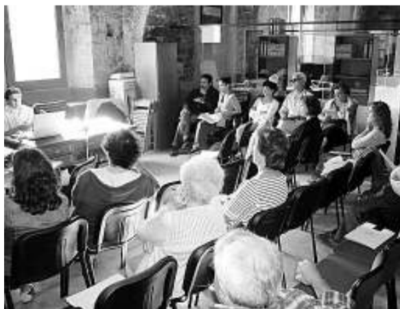
Jornada sobre participació ciutadana a Rupit.

► La dreta. Acostuma a considerar l'espai públic com un element més residual, li atorga, per principi, menys importància com a bé col·lectiu, d'acord amb la seva tradició poc entusiasta pel que fa a la intervenció dels poders públics en el funcionament de la vida social. Una altra cosa és que no tingui gaire en compte les potencialitats mercantils dels espais públics, com es posa de manifest en les grans superfícies comercials i d'oci que es van estenent arreu sota la gestió i el control de la iniciativa privada. Respecte a drets bàsics com ara la salut, l'educació o l'habitatge, la dreta tendeix a presentar la seva modalitat privada com a paradigma de rendiments i bons resultats, en contraposició amb la suposada ineficàcia i caducitat dels serveis públics.