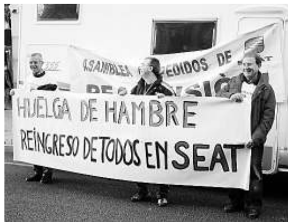
Protesta de treballadors acomiadats de Seat.

► La dreta. La seva aposta més clara és la consagració definitiva del mercat com a element evolutiu «natural» que porta el progrés arreu. Segons aquesta idea, com més globalitzada estigui l'economia i menys regulada pels poders públics, més possibilitats tindrà de créixer i de beneficiar sectors amplis de la població. És la metàfora de la mà invisible d'Adam Smith: el mercat fa compatibles els plans egoistes dels individus aconseguint la prosperitat per a tots i sense necessitat d'intervenció de l'Estat. En els últims anys hem vist la perversió d'aquest model perquè al costat del creixement econòmic augmenten també les desigualtats. Una dona pobre es preguntava, en una vinyeta recent: «Per què si el pastís és cada vegada més gran les porcions són més petites?»