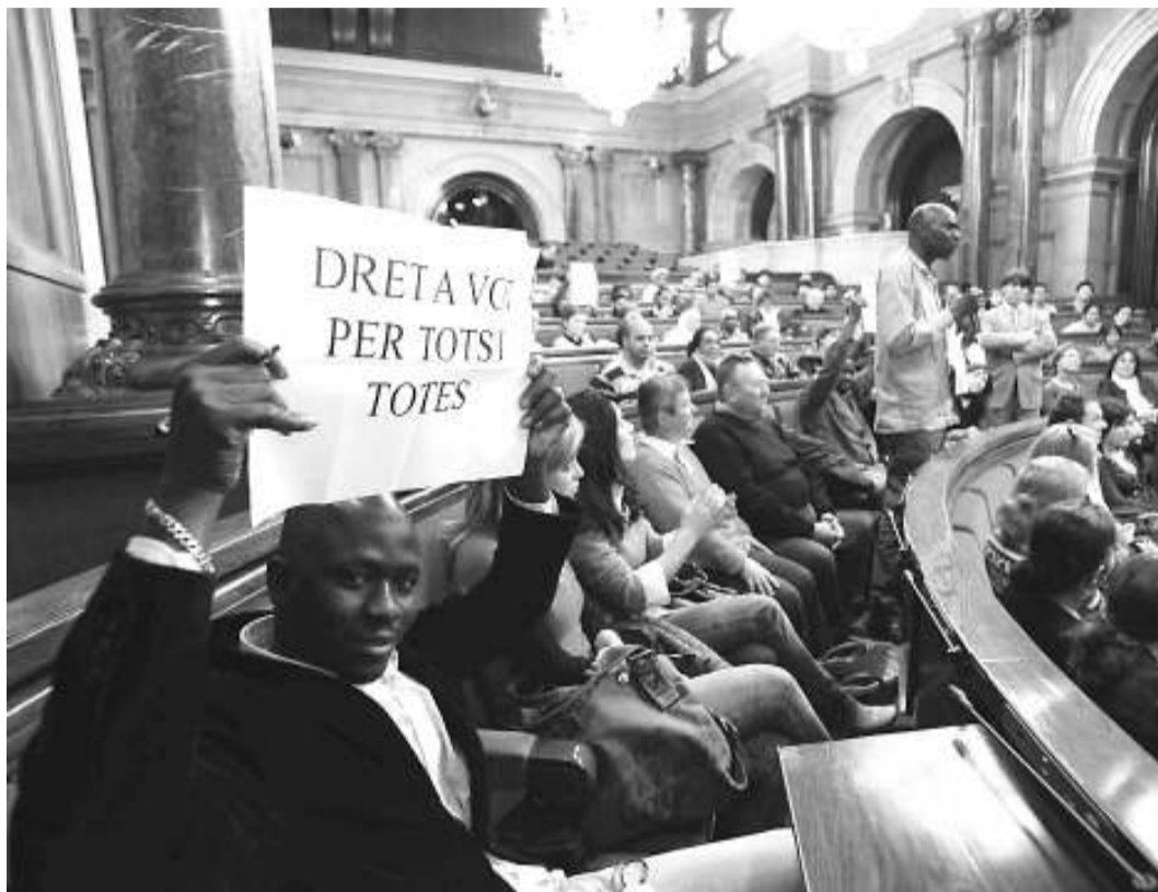
Durant una recent visita al Parlament de Catalunya, un nombrós grup d'immigrats va reivindicar el seu dret a la participació política.

flagrant tal com es destaca en el lema d'una campanya de sensibilització sobre aquest greu dèficit del nostre estat de dret impulsada per la comissió de Drets Polítics i Socials de la Coordinadora d'ONG Solidàries en col·laboració amb el diari El Punt : «Aquí visc, aquí treballo, aquí pago im-