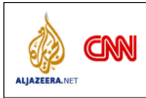
+ Logotips d'Al-Jazira i de la CNN.

La Cable News Network, més coneguda per la sigla CNN , va ésser la primera cadena de televisió a oferir notícies les vint-i-quatre hores del dia. Fundada el 1980 per Ted Turner, la CNN, amb seu a Atlanta (Geòrgia, EUA), va atènyer molta anomenada arran de la guerra del Golf Pèrsic (1991), per la cobertura gairebé instantània que n'oferí. Més o menys inspirada en la CNN, el 1996 va aparèixer la cadena de notícies en àrab Al-Jazira , amb seu a Qatar , que, oberta a punts vista distints, va insuflar una alenada d'aire fresc al panorama informatiu de l'Orient Mitjà.