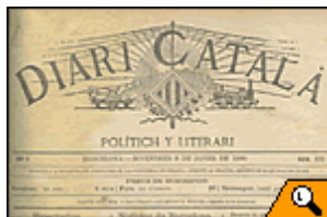
+ Capçalera del Diari Català.

El 1879 va néixer el primer diari escrit en català: el Diari Català , fundat per Valentí Almirall , home d'idees progressistes i primer teòric del catalanisme ('Lo catalanisme', 1886). El Diari Català no va tenir una existència gaire fàcil, i va deixar de publicar-se al cap de dos anys, el 1881. Aquest mateix any naixia La Vanguardia , en espanyol, que acaba de fer cent vint-i-cinc anys i que sempre ha tingut molt de predicament entre una part significativa de la classe mitjana del Principat.