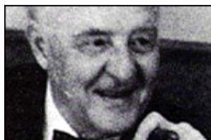
+ Retrat de n'Agustí Calvet, Gaziel.

La guerra del 1936-1939 i la dictadura subsegüent van estroncar la carrera periodística d'en Gaziel. Exiliat a França, a partir del 1940 va sojornar a Madrid, i no va tornar definitivament a Barcelona fins a les acaballes dels anys 1950. Després del conflicte bèl·lic, Gaziel, pregonament decebut per l'evolució dels esdeveniments (la derrota dels feixismes a la Segona Guerra Mundial, que va durar del 1939 al 1945, no va implicar la fi de la feroç dictadura franquista), va decidir d'escriure per sempre més en català i de dedicar-se, segons paraules pròpies, a les tres realitats superiors a totes les altres: la seva terra, la seva gent i la