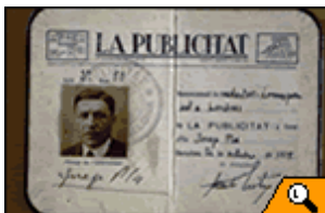
+ Carnet de premsa de Josep Pla.

La carrera literària de Josep Pla es remunta a la dècada del 1920 i s'inscriu en la pràctica del periodisme, de primer a La Publicitat i després a La Veu de Catalunya , dos dels diaris catalans més importants de l'època. En Pla féu de corresponsal a França, Itàlia, Anglaterra, Alemanya, Rússia i Espanya. De fet, els seus primers llibres són encàrrecs periodístics: 'Coses vistes' 'Cartes de lluny', 'Rússia'... Passada la guerra, va menar una vida sedentària a l'Empordà nadiu, si bé, els anys 1950 i 1960, gràcies als reportatges que li va encarregar el setmanari Destino, va poder reprendre l'activitat viatgera .