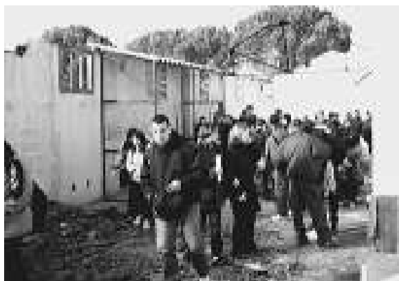
Alumnes alemanys i francesos visitant el camp.