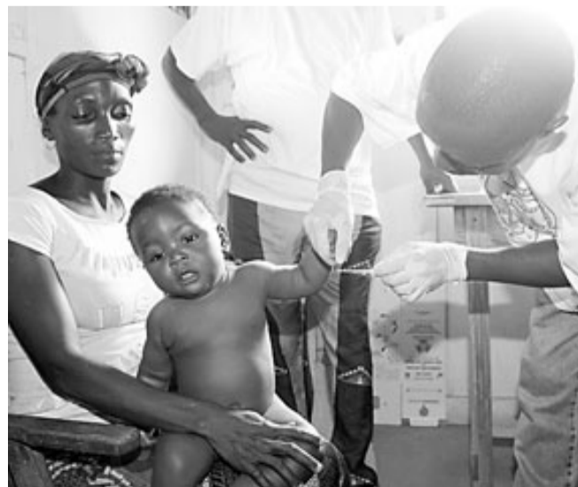
Els nens són el sector més vulnerable davant la malària.

Per curar-se, el tractament més habitual és l'ACT ( Artemisinin Combination Therapy ), que combina dos medicaments en una sola pastilla. Si les pastilles es prenen amb la periodicitat recomanada i a temps, el paràsit mor en tres dies. Es pot administrar un tractament preventiu a les dones embarassades. A banda de les medicines, altres praxis poden mantenir a ratlla els mosquits