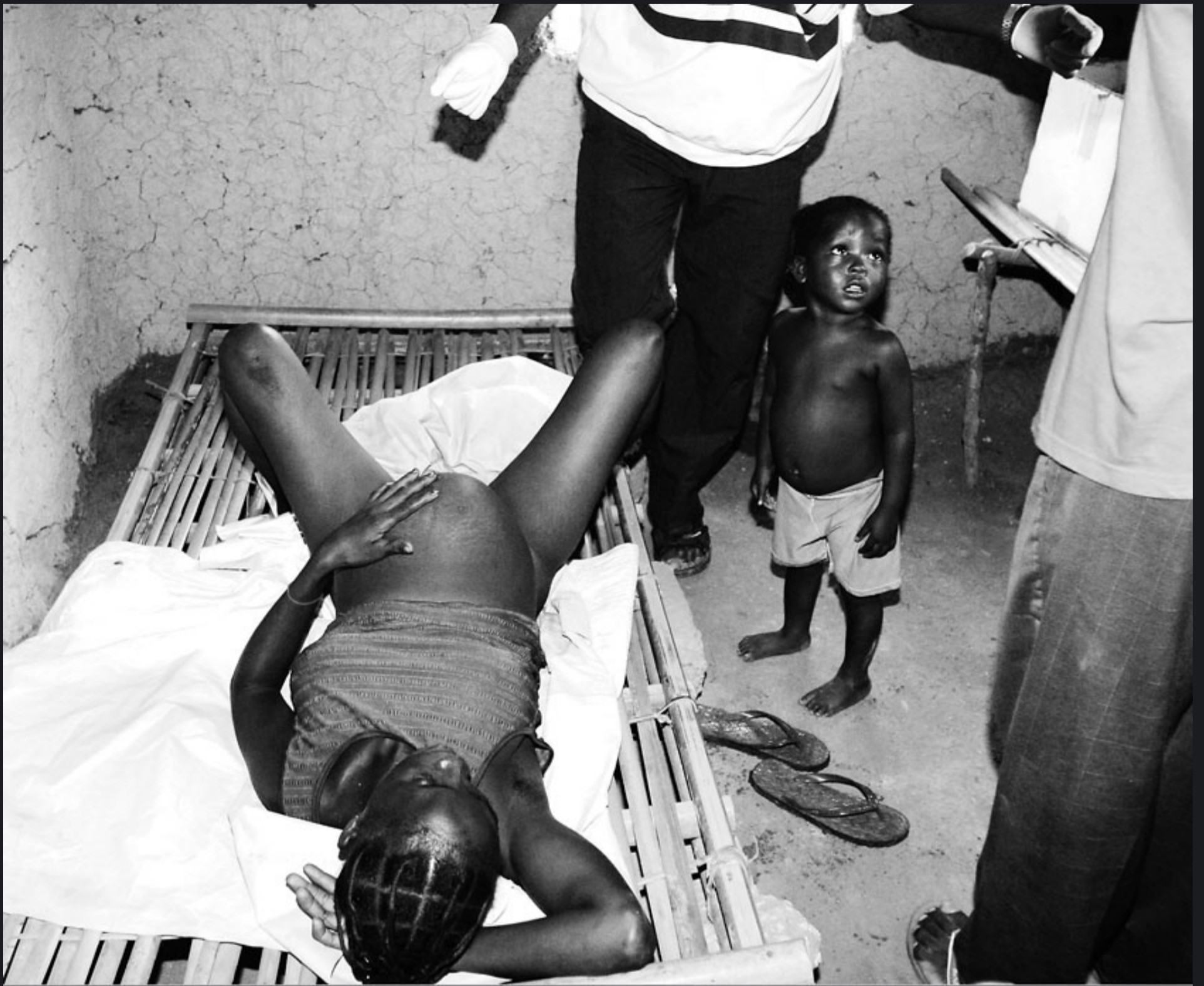
NÉIXER A LIBÈRIA. A la imatge, una jove mare està a punt de donar a llum un nen a la clínica de Cheboken. El repte del nou-nat serà sobreviure a la malària. La mare ha recorregut molts quilòmetres fins a arribar a la clínica. / M.R.