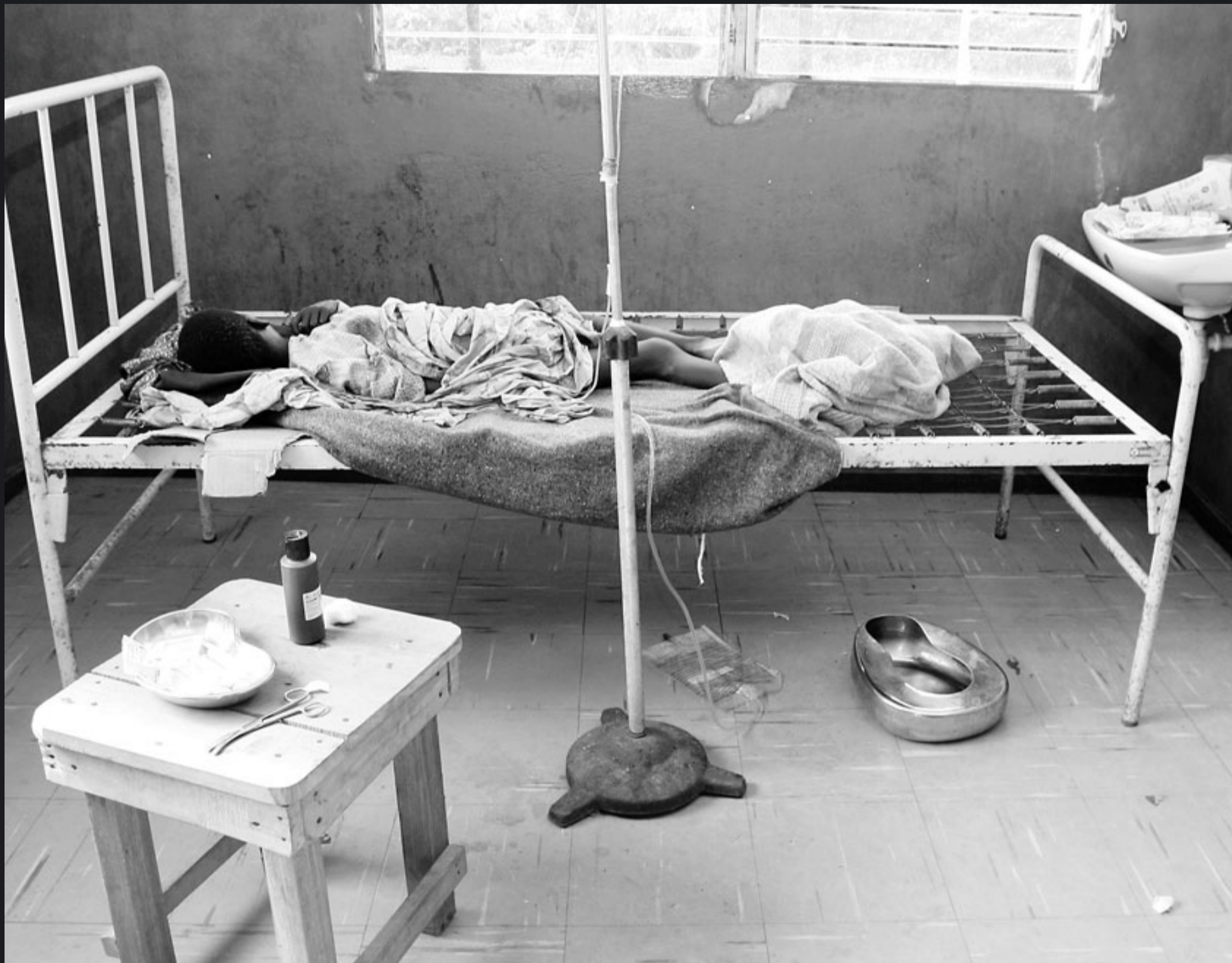
LA MALALTIA QUE NO PERDONA. Un nen malalt de malària, en estat de coma, en un hospital el comtat de River Gee. A Libèria l'esperança de vida és de 41,13 anys. Són moltíssims els nadons que no arriben als cinc anys de vida.

s'hi sumen els que pateixen les famílies que viuen allunyades de les clíniques. Ens expliquen situacions en què moltes mares, que han de caminar hores i hores per portar un fill malalt a l'hospital, han de prendre una cruel decisió: salvar el fill malalt o quedar-se a casa amb la resta de nens petits i cultivant el camp per tenir alguna cosa per menjar.