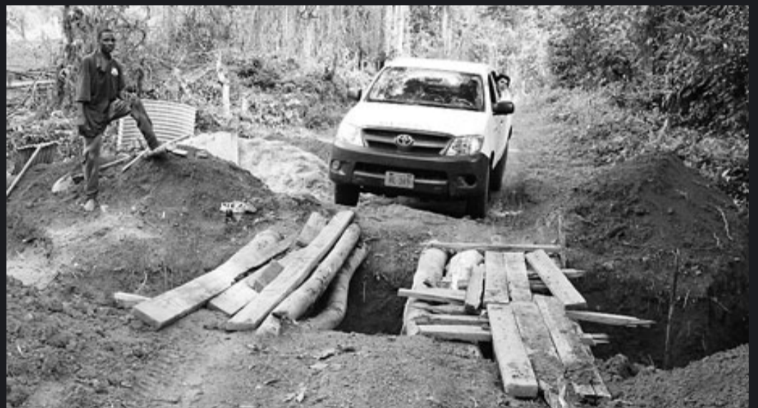
MOSQUITERES PER A TOTHOM. A dalt, els voluntaris de Mentor i del Ministeri de Salut recorren les cases repartint teles mosquiteres i ensenyant com s'han de col·locar perquè siguin més efectives. A baix, el carrer com a centre de la vida dels liberians. A la dreta, estat de les carreteres que té el país, on dels 10.600 quilòmetres només 657 estan asfaltats.