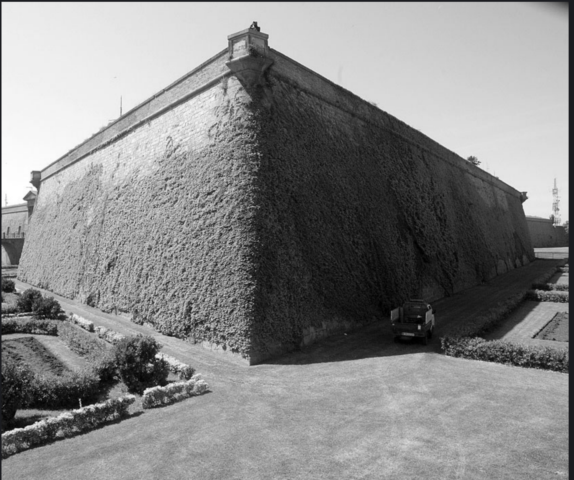
Tot i que el Ministeri de Defensa ha mantingut fins ara la gestió del castell, de l'entorn se n'ha fet càrrec l'Ajuntament, que ha convertit els fossars del castell en un gran passeig enjardinat per on circulen a diari milers de turistes.