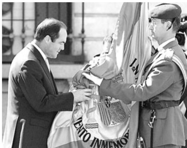
José Bono, en un acte oficial quan era ministre de Defensa.