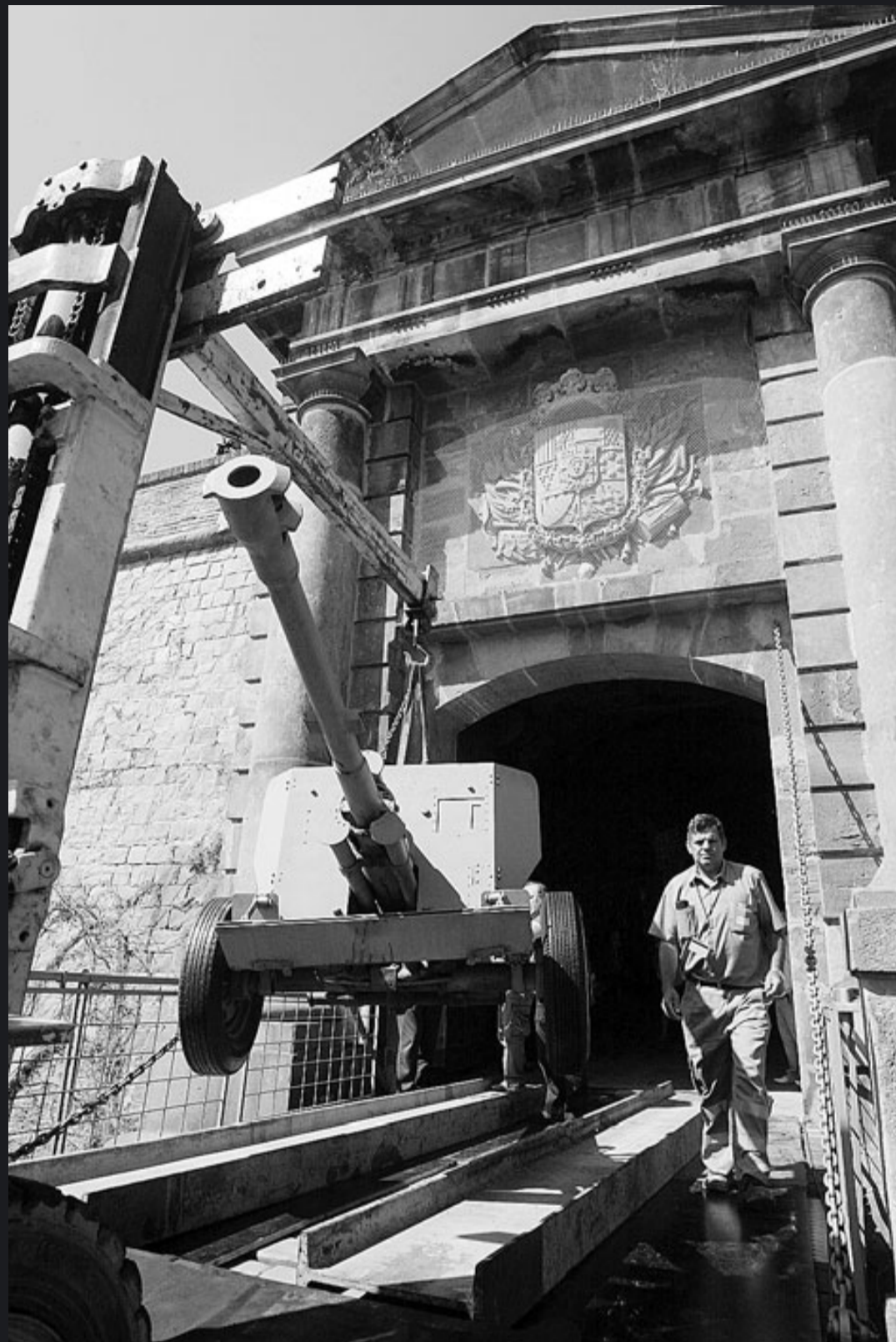
Desmuntatge dels canons que hi havia al pati d'armes del castell, dies abans de la festa ciutadana del 15 de juny.

Internacional del 1929—, des del moviment obrer es va imaginar diverses vegades un improbable assalt al castell. El que va estar més a prop de produir-se va ser el que el 1919, arran de les detencions massives per la vaga de La Canadenc, va fer avortar Salvador Seguí, el Noi del Sucre, que ho considerava un suïcidi.