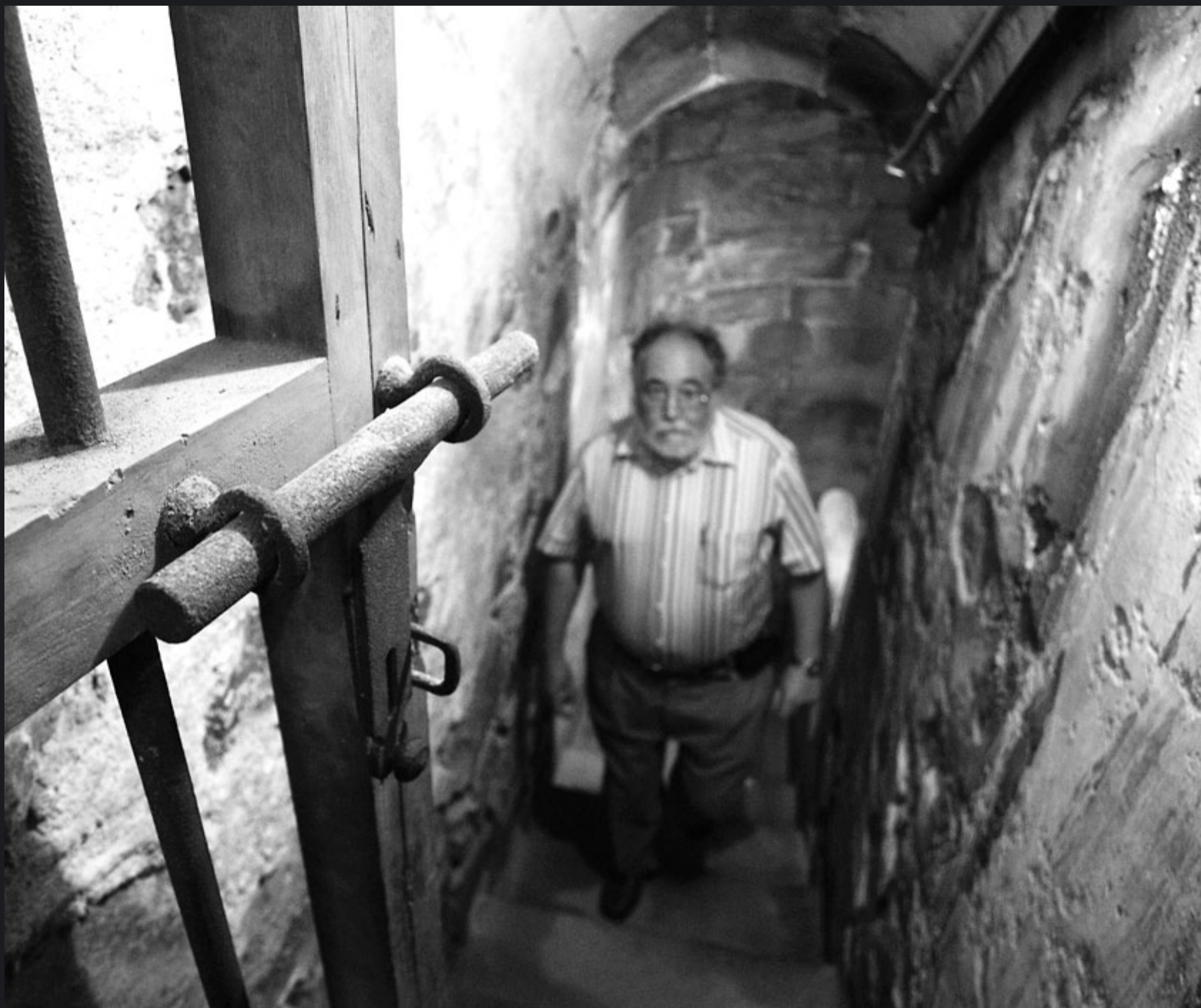
Es diu que per aquestes escales va baixar Lluís Companys fins al fossar de Santa Eulàlia el matí que el van afusellar. Aquest és un dels racons que s'han obert al públic gràcies al canvi de gestió del castell.

sència militar durant tres anys per custodiar unes antenes que l'exèrcit encara considera estratègiques per a la defensa nacional . L'ordre ministerial va arribar després de tres anys de negociacions entre l'Ajuntament i el Ministeri de Defensa, iniciades arran d'una promesa electoral de José Luis Rodríguez Zapatero el juny del 2004, durant un míting a Barcelona per les eleccions al Parlament Europeu. La promesa, però, va topar amb l'obstacle dels mateixos representants del govern espanyol, que volien garantir sobretot la presència de la bandera espanyola i que la cessió definitiva del castell no pogués ser