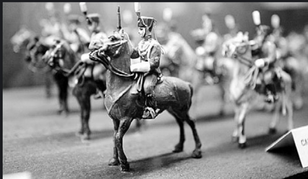
La simbologia feixista ha estat present al castell de Montjuïc fins avui mateix. Al museu militar s'exposen banderes, figures i uniformes, i a l'entorn de la fortalesa hi va haver un monument als caiguts i una estàtua eqüestre de Franco. /O.D./G.M.