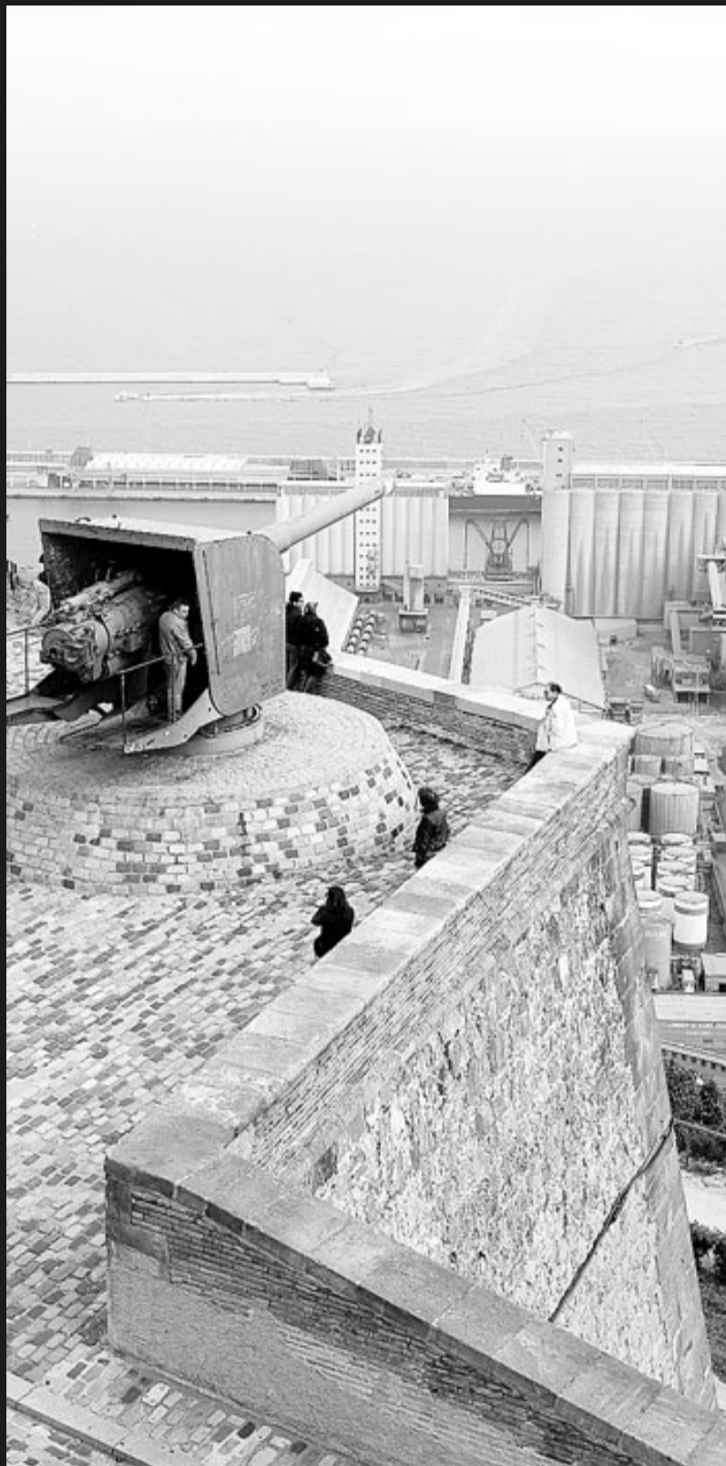
Els canons exteriors del castell encara hi són, i l'Ajuntament en vol mantenir alguns.