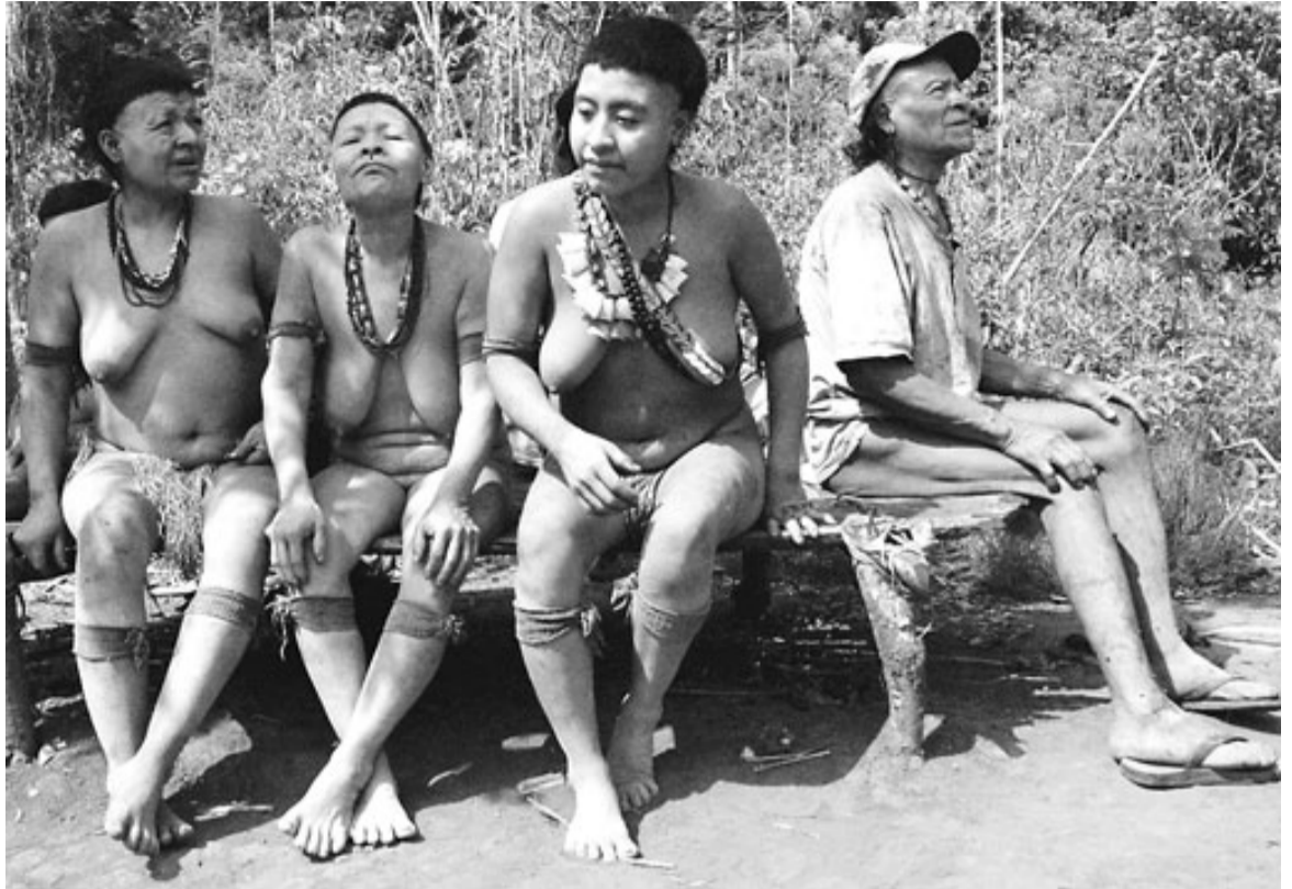
Quatre dels últims akutsu . / SURVIVAL

Són recol·lectors, cacen alguns animals de la selva, com els tapirs, i conreen blat de moro i mandioca. Com que la seva existència es va difondre a la premsa internacional, s'ha aconseguit que part de les seves terres siguin respectades, però ja és massa tard.