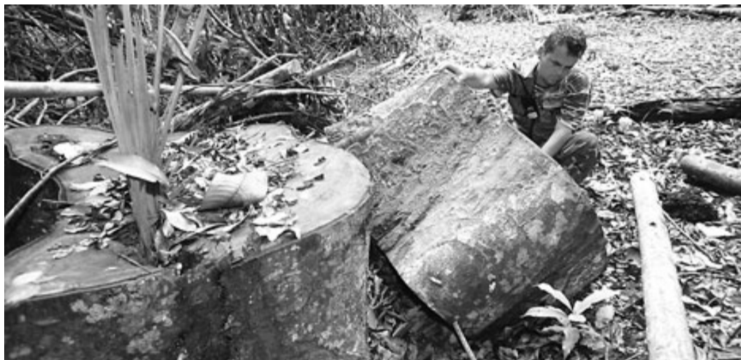
Dues imatges de la desforestació que pateix la selva amazònica per culpa de la tala il·legal.

governos ni multinacionals podrien ocupar les seves terres com ho fan, ja que l'interès que despertaria la seva situació mouria les persones a actuar perquè els