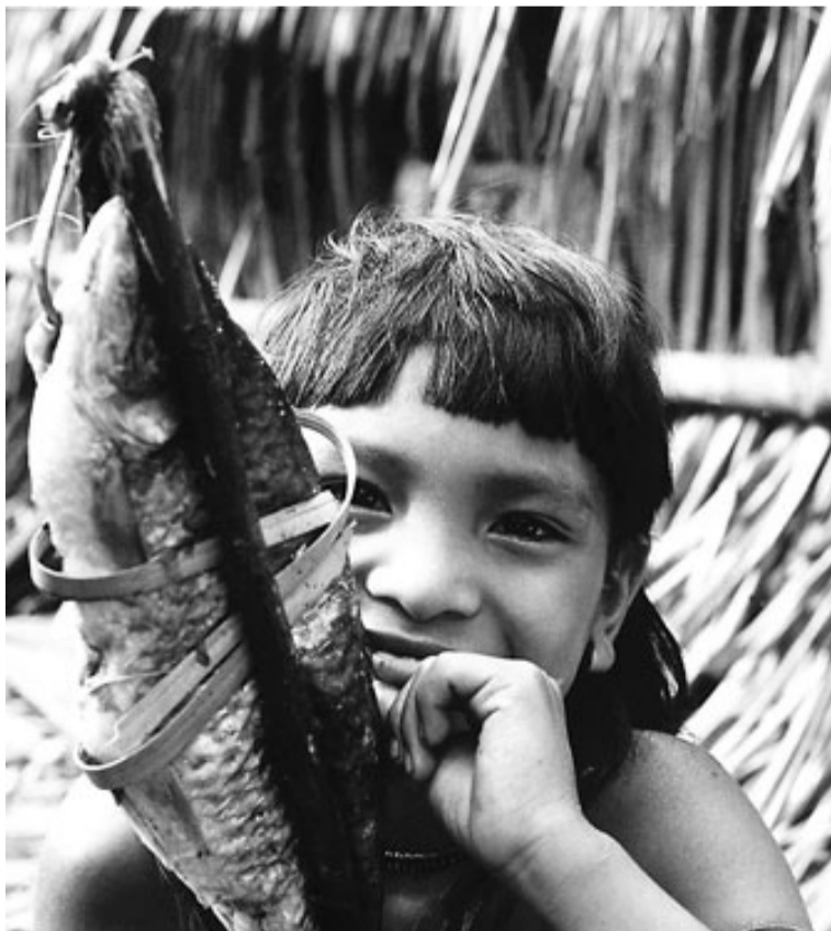
Un nen enawené nawé mostra un peix fumat. /SURVIVAL

grans preses, amb trampes de fusta, que els permeten pescar molts peixos. Després els fumen per poder-los conservar. Una de les característiques principals d'aquesta tribu és que pràcticament no mengen carn. Durant tres dècades les seves terres han estat devastades per industrials de la fusta, recol·lectors de cautxú, prospectors de diamants i companyies alimentàries que utilitzen grans extensions de selva desforestada per conrear soja. El seu territori va poder ser demarcat gràcies a un jesuïta espanyol, Vicente Cañas, que va con viure molts anys amb ells. Va ser assassinat el 1987, se suposa que per sicaris llogats per impedir que els continués defensant.