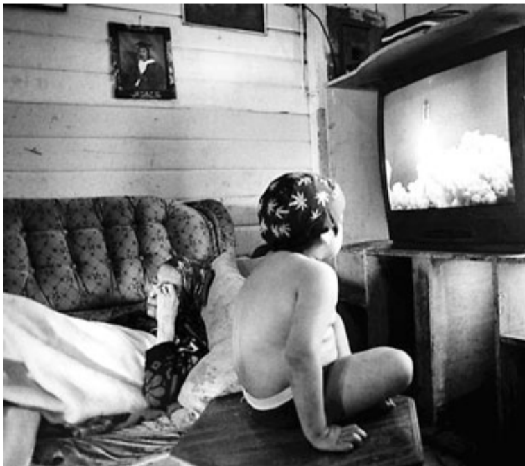
Un nen mira la televisió en una llar innu .

Tot i que ara bona part dels innu s'han convertit en assalariats o viuen de prestacions socials, també hi ha grups que volen mantenir vives les seves tradicions i continuen caçant i pescant. També reclamen que se'ls reconegui la propietat de les seves terres.