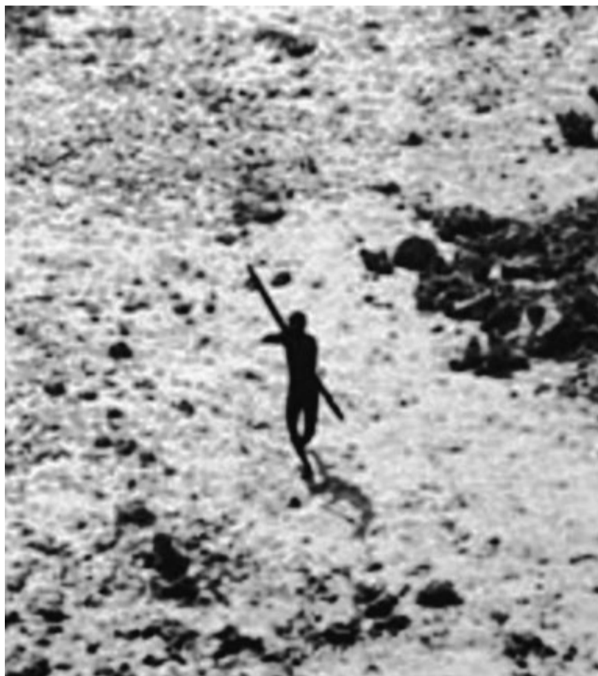
Un sentinelès apunta amb una llança a un helicòpter que sobrevola la seva illa.

vida són els anomenats gana i gwi , que viuen a la reserva de caça del Kalahari central, a Botswana. Els responsables de Survival asseguren que, en lloc de reconèixer els seus drets de propietat sobre la terra on han viscut durant milers d'anys, el govern de Botswana els està expulsant, perquè vol impulsar les activitats turístiques. L'assetjament va començar el 1986, i els primers trasllats forçosos es van fer el 1997. Els boiximans que no van voler marxar van patir restriccions dràstiques dels seus drets de caça. A començaments de 2002 la repressió es va endurir i les autoritats van destruir les seves reserves d'aigua, mentre preparaven la construcció d'un gran complex hotel·ler. Això ha originat una campanya internacional en suport dels boiximans i una reacció contundent del govern de Botswana contra Survival.