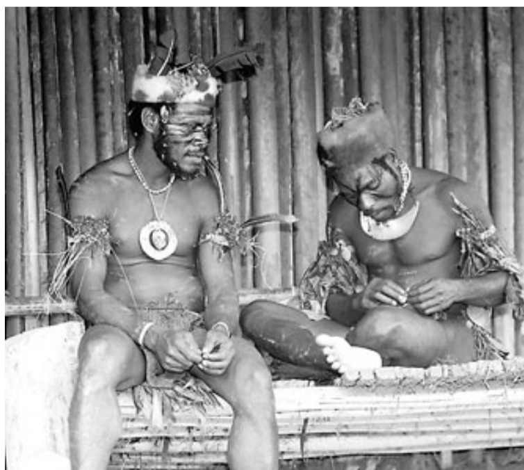
Una de les imatges dels indígenes que ha facilitat Antonio Cruz-Mayor.

L'empresari diu que ha viatjat sobre el terreny per conèixer els membres d'aquesta tribu i assegura que el seu principal objectiu és divulgar la situació de vulnerabilitat en què es troben perquè els seus territoris s'estan desforestant, ja que s'hi ha trobat or. Hi ha qui dubta, però, de la seva bona voluntat, perquè a la web de l'expedició [expedicioncruzmayor.com] també s'assegura que un desenvolupament turístic de la zona, encara que fos modest, beneficiaria els autòctons.