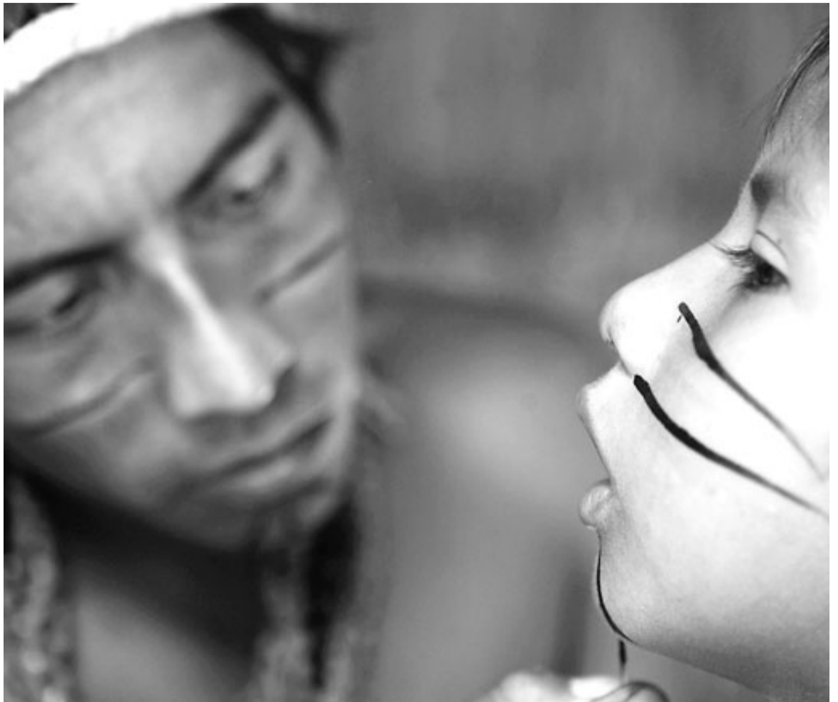
Un adult pinta un nen guaraní amb les pintures tradicionals, en una comunitat brasiler.

un indret que anomenen Terra sense Mal, el lloc de descans de l'ànima després de la mort. Això ha fet que al llarg dels segles, molts guaraní hagin emprès llargs viatges en un intent de trobar aquest indret. Al Brasil, els guaraní estan sofrint el robatori de pràcticament tota la seva terra. Senten aquest robatori com