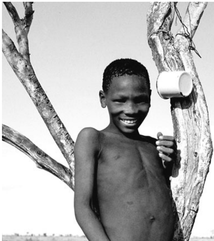
Un nen boiximà al desert del Kalahari central, a Botswana.